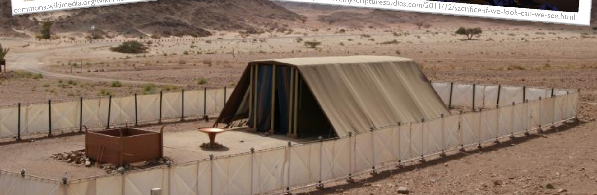
Ruk7, Wikimedia Commons, lizenziert unter CreativeCommons-Lizenz by-sa 3.0, https://en.wikipedia.org/wiki/Tabernacle#/media/File:Stiftshuette_Modell_Timnapark.jpg